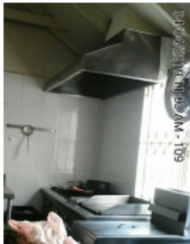
Fotografía No. 5 Estufa Industrial