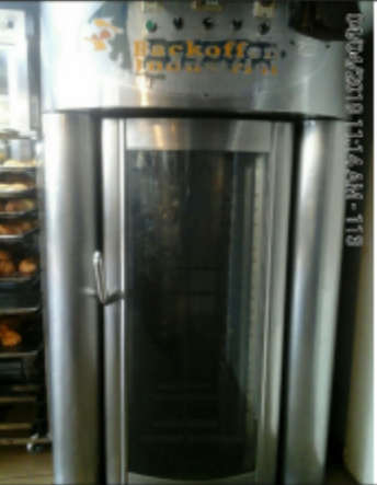
Fotografía No. 3 Horno Backoff