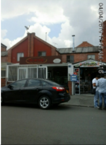
Fotografía No. 1 Fachada del predio