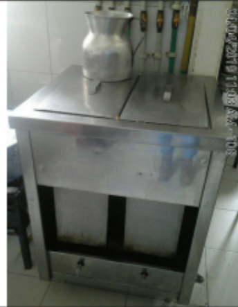
Fotografía No. 4 Estufa tamalera