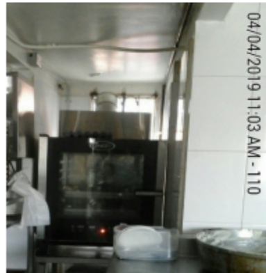
Fotografía No. 6 Horno Unox