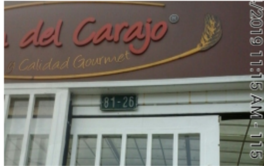
Fotografía No. 2 Placa del predio